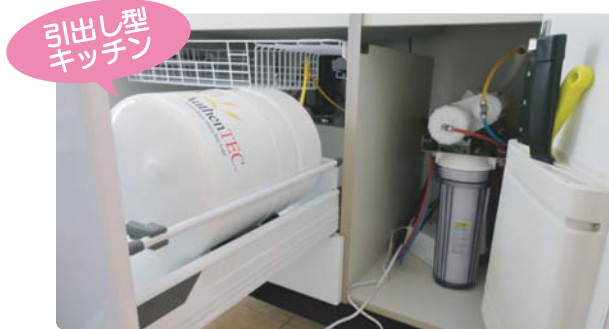
引出し型キッチン